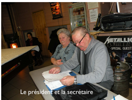
Le président et la secrétaire

C'est dans une ambiance très détendue et amicale que s'est déroulé l'Assemblée Générale du Club Léo Lagrange de Sallaumines.