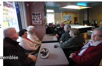
Une partie de l'assemblée